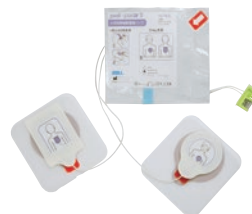
小児用除細動電極パズ pedi・padz II