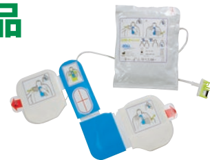
体表用除細動電極パズ CPR-D・padz