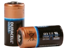
リチウムバッテリー 3V DC (123A型)